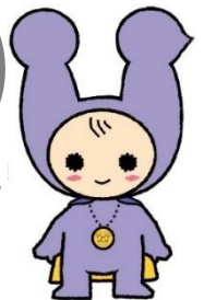
リーブラのマスコットキャラクター “りぶら”