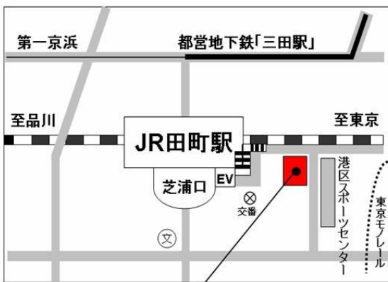
男女平等参画センター「リーブラ」3～5階

●休館日情報●リーブラの8月の休館日は、8月4日（日）・18日（日）です。入館できませんのでご注意ください。