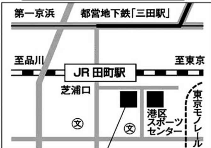
男女平等参画センター「リーブラ」3~5階