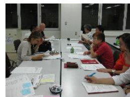
委員会では様々な意見が出されます。

今年は言葉としてテーマは設定しませんが「お互いが助け合ってつながって行くフェスティバルにしたい」という方針を共有し、コラボレーション企画、広報委員の新設など、より多くの皆さんにフェスティバルにご参加いただけるよう、取り組みを始めています！