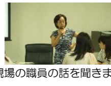
現場の職員の話をお聞きします