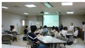
学生同士の出会いも貴重な経験でした