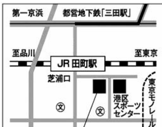
男女平等参画センター「リーブラ」3～5階

6月の「「災害・復興と男女共同参画」6.11 シンポ」では、性別役割の固定化、政策決定過程における女性の参画の少なさ、復興基金をはじめとした支援が柔軟でないことなどが、これまでの国内外の災害復興におけるジェンダー課題として指摘されました。こうした問題提起を踏まえ、東日本大震災復興対策本部による「東日本大震災からの復興の基本方針」(7月29日決定、8月11日改定)の基本的考えにおいては、「男女共同参画の観点から、復興のあらゆる場・組織に、女性の参画を促進する」とされています。実際には、女性や子どもに対する暴力などさまざまな問題が被災地で起き、また「復興」の見通しの立たない地域からの避難者の存在など、こうした方針がどのように実現されるべきか、多様な被害に対しどのような支援が必要であるかなどについて、今後ともに考え、協力していく必要があるでしょう。