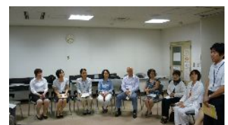
ワークショップの様子 参加者同士活発に交流できました