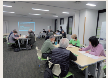
リーダー・サポーター交流会