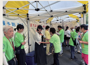
区民まつり体力測定イベント