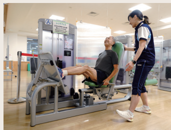
マシントレーニング