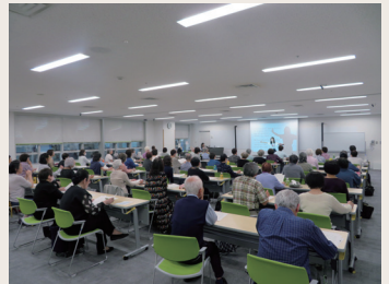
ボイストレーニングイベント

これから健康づくりを始めたい人や、日々の生活をより充実させたい人は、是非ご利用ください。